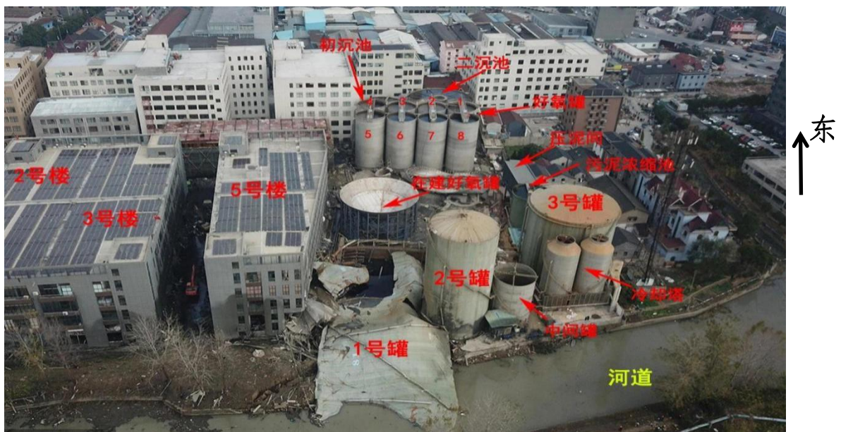
事故发生地及周边航拍图（事发后拍摄）