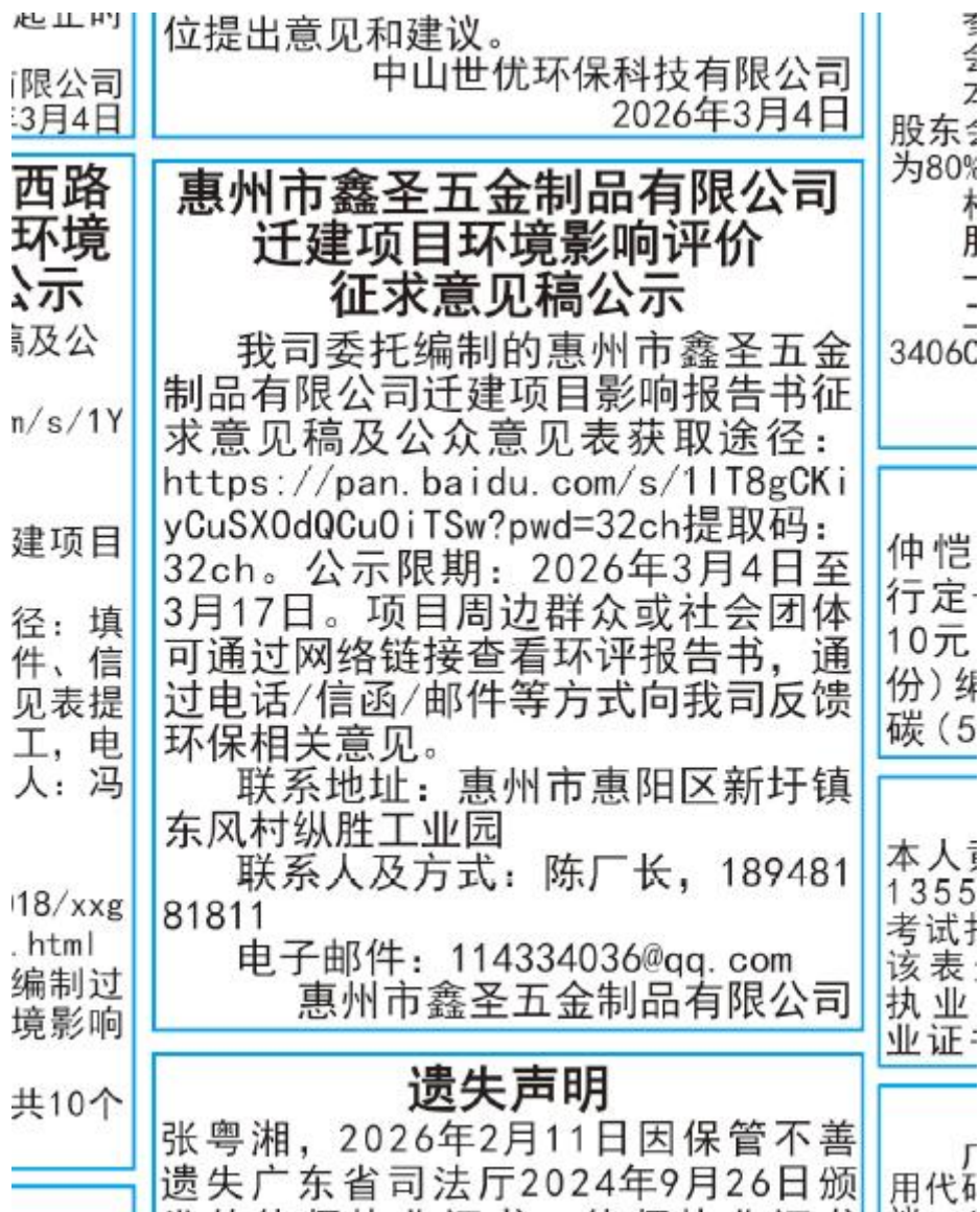
图 3.2-3 征求意见稿报纸第一次公示截图（大图）