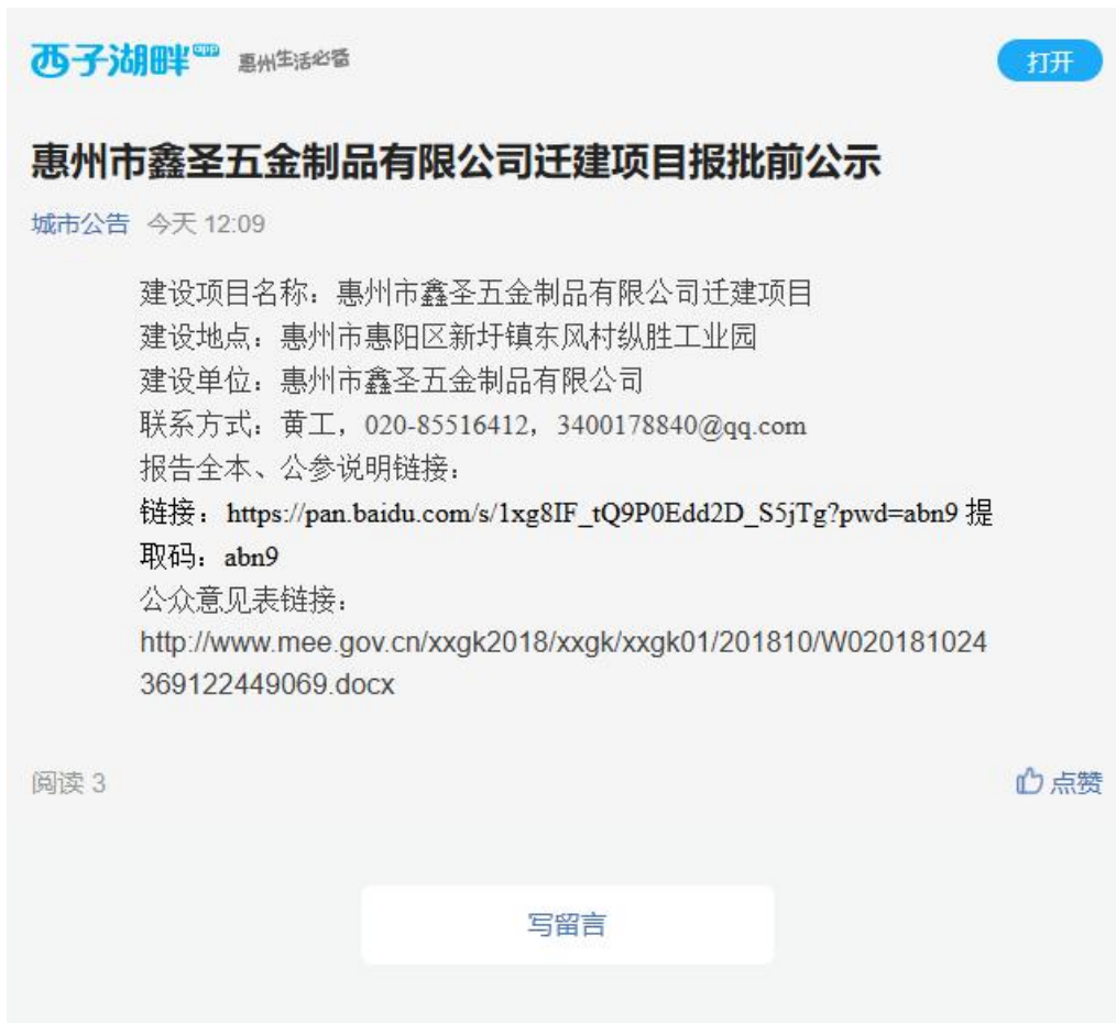
图 5.2-1 报批前公示网络公示截图

网络公开链接地址为：惠州市公共媒体网站“西子湖畔”（ https://www.xiziquan.com/index.php?r=article/detail&id=3003#/articleDetails ），截图如下所示。