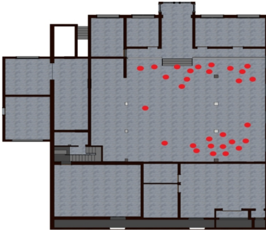
图 1：遇难者位置示意图

3.医疗救治和善后处置。 指挥部医疗保障组采取“一人一方案、一人一小组、一人一档案”方式，全力救治伤员。国家卫健委派出 4 名、省卫健委派出 20 名医疗专家，指导当地开展伤员救治工作。襄汾县委、县政府成立 42 个工作专班，对遇难者家属和受伤人员进行安抚、抚恤。截至 9 月 30 日，28 名受伤人员中已有 27 人治愈出院，1 名危重症伤员在山西医科大学第一医院住院治疗，目前生命体征平稳；29 名遇难者已于 9 月 10 日前全部安葬。