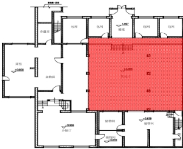
图3：坍塌部分平面图

事故坍塌部分为宴会厅、北楼二层南半部分和钢结构采光顶棚，坍塌部分房屋建筑面积为 252.59m 2 。（坍塌部分平面图见图 3、坍塌部分剖面图见图 4）